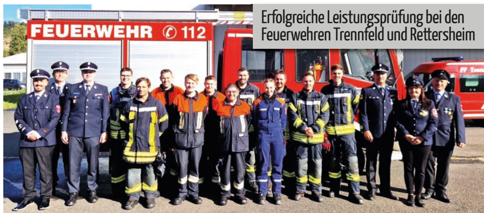
Erfolgreiche Leistungsprüfung bei den Feuerwehren Trennfeld und Rettersheim

Protokolle des öffentlichen Teils der Gemeinderatssitzungen finden Sie auf der Homepage unter der Rubrik „Gemeinderat/Protokolle“.