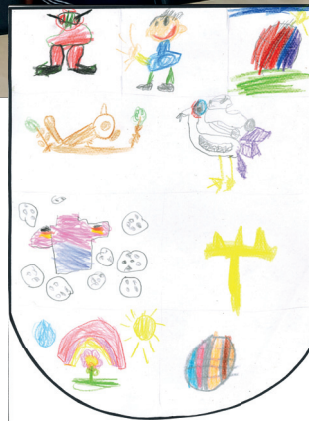
Im Bild: Das Triefensteiner Wappen nach Ideen der diesjährigen Rettersheimer Vorschulkinder

Wir freuen uns bereits auf den nächsten Besuch!