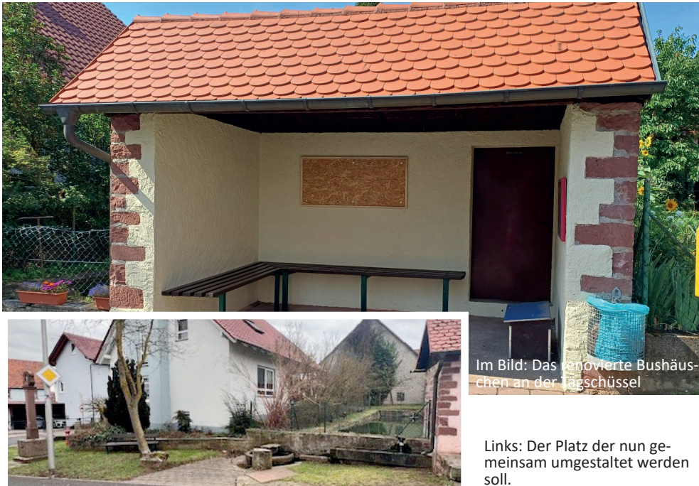
Im Bild: Das renovierte Bushäuschen an der Tägschüssel

Aus diesem Grund laden wir zu einem Informationstreffen am Dienstag, den 20.08.2024 um 18:00 Uhr vor Ort an der Tägschüssel ein. Mitgestalten wollende ehrenamtliche Bürgerinnen und Bürger und natürlich auch Interessierte sind herzlich willkommen.