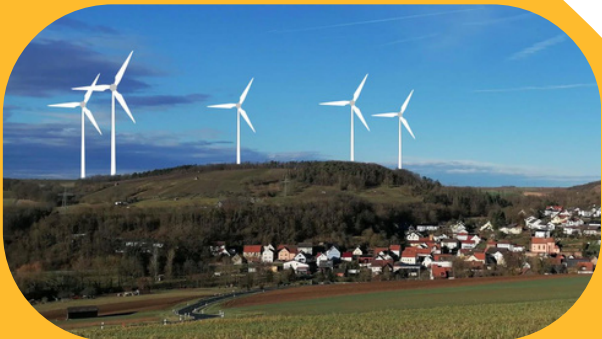
Wüstenzell (Fotomontage: Bürgerinitiative)