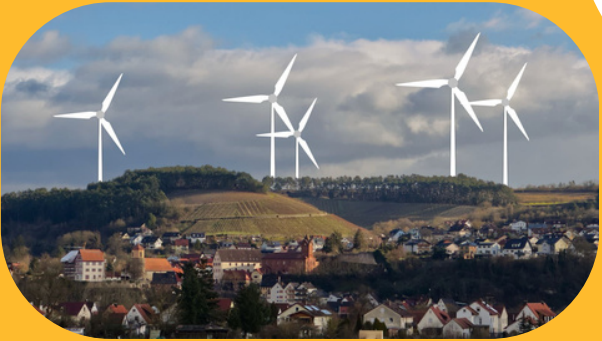
Homburg (Fotomontage: Bürgerinitiative)